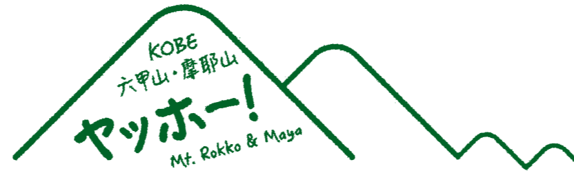
ロゴマーク(コミュニケーションマーク)

神戸市街地の“裏山”となる六甲山系の山並みをモチーフに、親しみやすさを感じさせるコピーをメインに配置。当該プロジェクト関連のメディアに表示する。