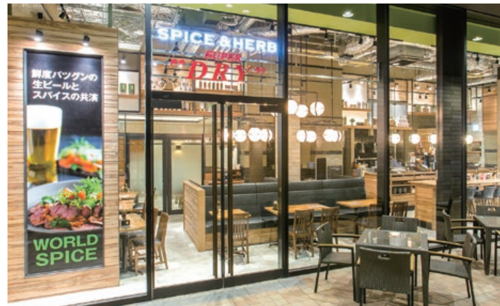
・サブエントランス