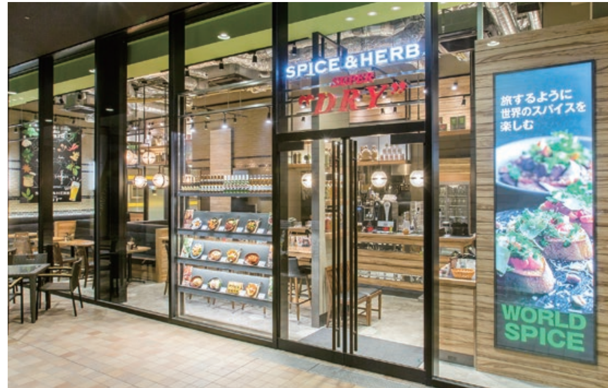
・メインエントランス

ユニセックスを意識した、「スタイリッシュな中にも、心地良さがあるカジュアル」テイスト