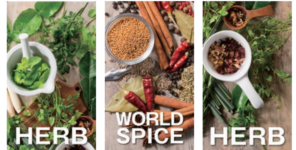
・サンプルケース内 イメージPOP