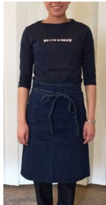
・パート&アルバイト (カットソースタイル) フロントにロゴプリント