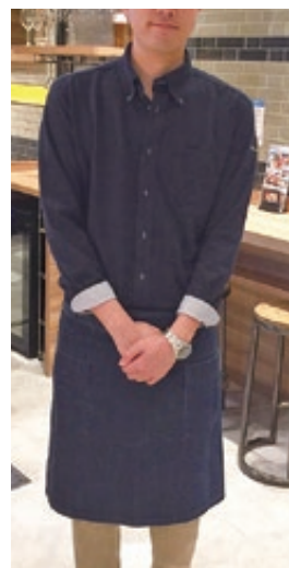
・社員(シャツスタイル) 右腕にロゴ刺繍

程よくカジュアルダウンされたリラックス感。ワークスタイルをイメージした、デニムのサロン+ネイビーカットソー